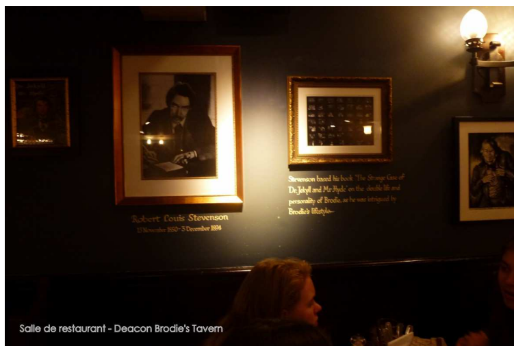
Salle de restaurant - Deacon Brodie's Tavern

Notre balade s'est terminée dans le Pub Deacon Brodie's Tavern, un Pub plein de cachet, toujours rempli et bruyant, mais vraiment sympa et qui aurait inspiré Stevenson pour son roman Dr. Jekyll et Mr. Hyde.