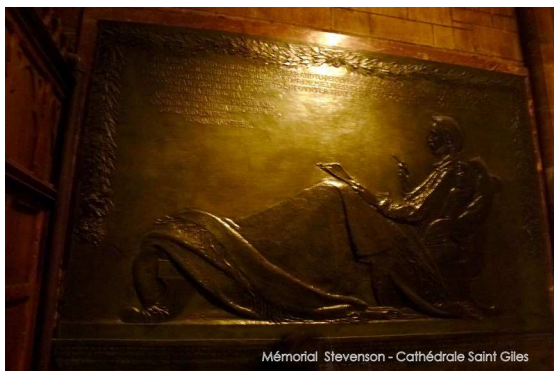
Mémorial Stevenson - Cathédrale Saint Giles