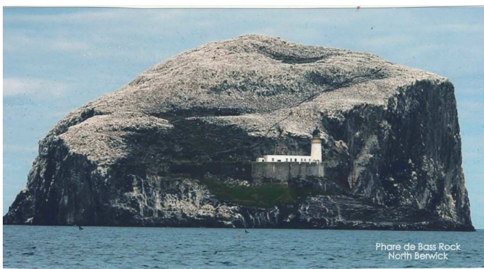
Phare de Bass Rock North Berwick

Le hasard nous a fait rencontrer un pêcheur de langoustes revenant de la pêche qui nous a été présenté comme un descendant de la famille Stevenson.