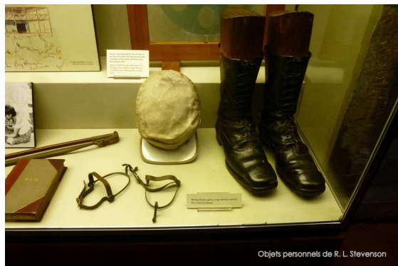
Objets personnels de R. L. Stevenson