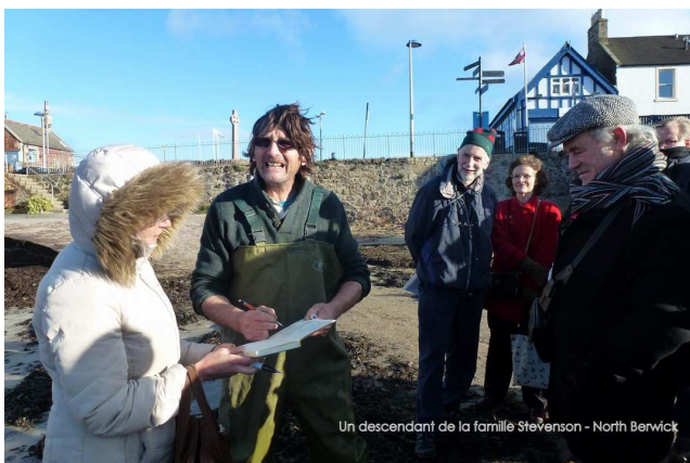
Un descendant de la famille Stevenson - North Berwick

Le hasard nous a fait rencontrer un pêcheur de langoustes revenant de la pêche qui nous a été présenté comme un descendant de la famille Stevenson.