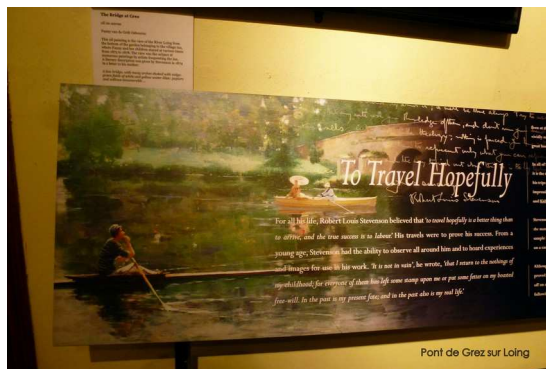
Pont de Grez sur Loing