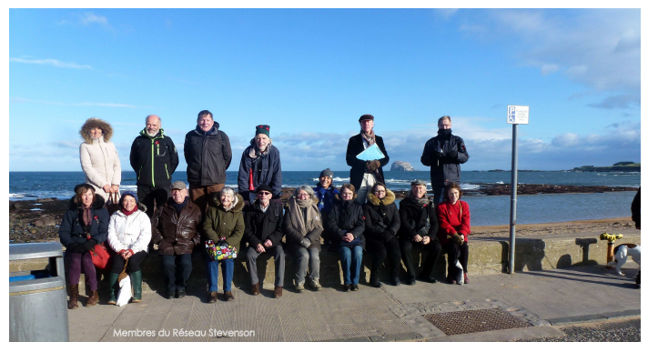
Membres du Réseau Stevenson